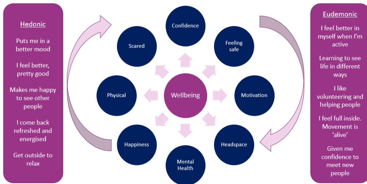
Diagram 3: Gwybodaeth ac ymwybyddiaeth dysgwyr o les a disgrifwyr

Canfuwyd bod y term 'lles actif' fel y'i ddefnyddir yn y strategaeth, yn llai cyfarwydd: "Ddim yn gyfarwydd â'r term 'lles actif', ond 'lles', ie, trwy'r coleg a therapi" . Roedd gan un dysgwr dehongliad ychydig yn wahanol o'r gair 'actif' fel rhywbeth mwy 'parhaus': Disgrifiwyd lles fel "edrych ar ôl eich hun a sicrhau eich bod yn iach. Os nad ydych yn iawn yn eich hun sut gallwch ofalu am eraill a'ch teulu? Weithiau mae angen amser i adfywio. Mae lles actif yn gwneud hynny'n barhaus yn rheolaidd" . Gallai cyfathrebu mwy cyson gan golegau gan ddefnyddio'r iaith hon helpu i gynyddu ymwybyddiaeth a chynorthwyo mesur darpariaeth 'lles actif' yn y dyfodol, a chaiff hyn ei drafod ymhellach isod.